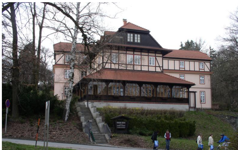
Obrázek 6: Současný stav penzionu DIANA

Zpracoval: kolektiv „historických nadšenců ze Zbrašova a okolí“: