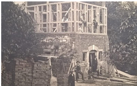
Obrázek 3: Stavba Búdy (1910)

„Nad tímto přízemkem chci postaviti z hrázděných uvnitř však asi 5 cm korkovými deskami obložených zdí, bývání o kuchyni a světnici, které nyní, aspoň na čas než postavím chalupu – v situaci vedle příjezdu uloženou – za byt pro hlídače sloužiti má. Tento byt mi po případě, že po sedmi letech, po kterou dobu mi dojde nájem lázní, (budu-li živ), posloužiti mi co letní byt.“