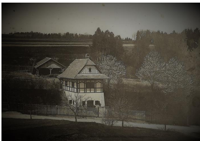
Obrázek 4: Vinný sklep Búda při cestě do Hranic

Po vypuknutí první světové války, nechtěl Tebich lázně v nové lázeňské sezóně v 1915 vůbec otevřít. Obecní rada města Hranic, která po řadu let usilovala o koupi, nebo alespoň nájem lázní, požádala proto, po dohodě s Tebichem, novou majitelku lázní o jejich přenechání na zbytek nájemní