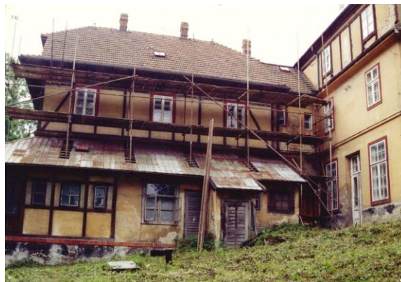
Obrázek 5: Stav objektu Zory při započetí rekonstrukce

Bohužel ani tato změna vlastníka Zory nepřinesla kýžený obrat k lepšímu a budova stále chátrala, a i nadále sloužila pouze jako ubytovna (spíše noclehárna) pro pár dělníků a zaměstnanců a částečně i jako sklad. Jediným pozitivem byla skutečnost, že spolu s revizí plánů na rozvoj lázní přestala být stavba překážkou v zastavovacím plánu tohoto rozvoje. Díky této změně proto nedošlo k původně plánované demolici budovy, ale tato byla postupně pouze „vybydlována“.